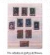
Une collection de cartes postales, octobre 1918 - 1919